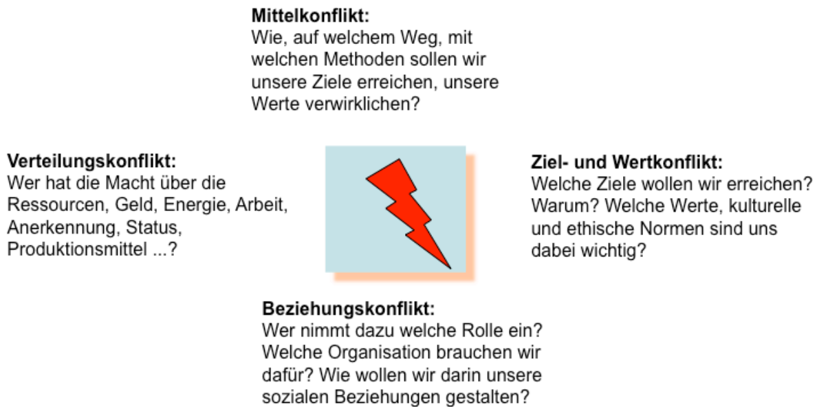
Abbildung 2.1: Konfliktquadrat

Zielkonflikt: Menschen sind bestimmt durch unterschiedliche Ziele und Interessen. Unterschiedliche Zielsetzungen beziehen sich ihrerseits auf unterschiedliche Werte, was mir an meinen Zielen wertvoll ist, sei es z.B. das jeweilige meine Hemd, das mir am nächsten ist, oder der Konflikt von Gemeinschaft und Individuum.